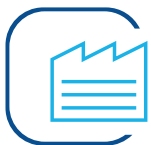
Fassaden- und Dachtechnik