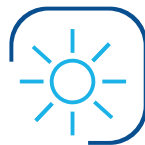
Tageslichttechnik und Sonnenschutz