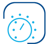
Steuerung und Regelung