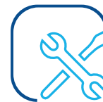
Montage, Wartung und Reparatur